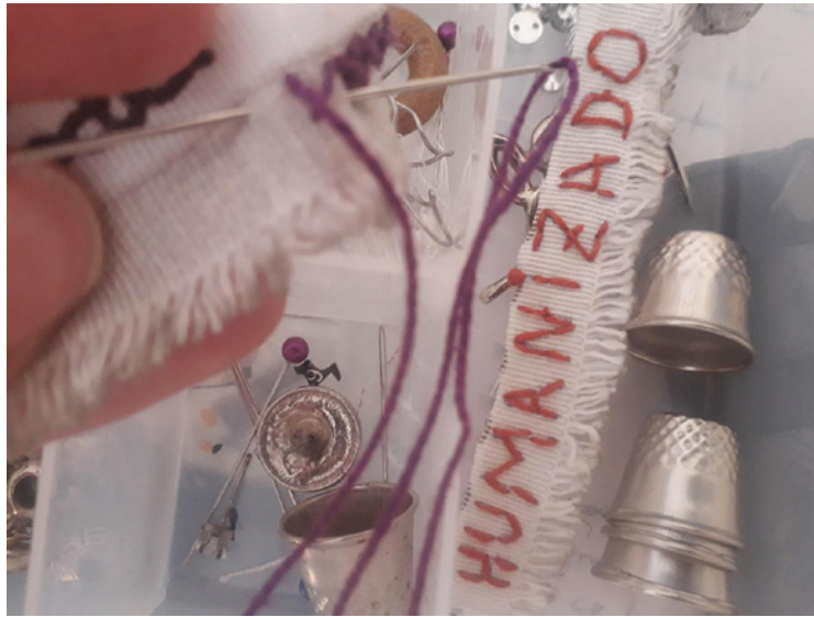
Imagens: Autora Performance “memórias, bordados e foto-gestos”. Registros: fotografia Luiz Pereira; Fotografias (dimensões 3x4): Jesus Lemos.