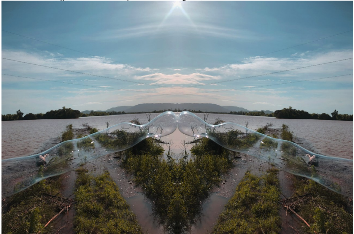
Figura 3 – Caminho-reflexo , 2024. Mobgrafia, 40x60 cm. Dona Francisca-RS