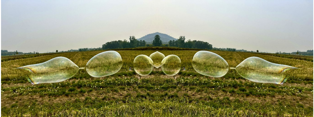
Figura 7 – Manifestação da bolha no pousio de arroz , 2024. Mobgrafia digital, 24x60 cm. Agudo-RS