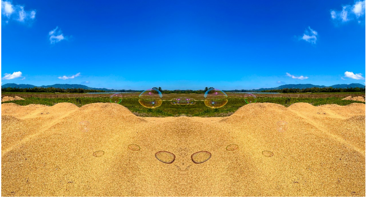
Figura 5 – Reflexo em movimento , 2024. Mobgrafia, 32x60 cm. Agudo-RS