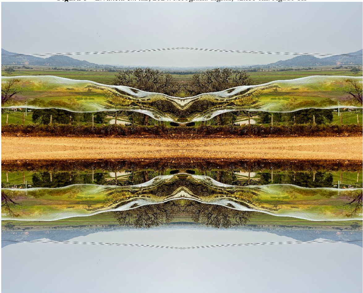
Figura 6 – Errância em luz , 2024. Mobgrafia digital, 42x60 cm. Agudo-RS