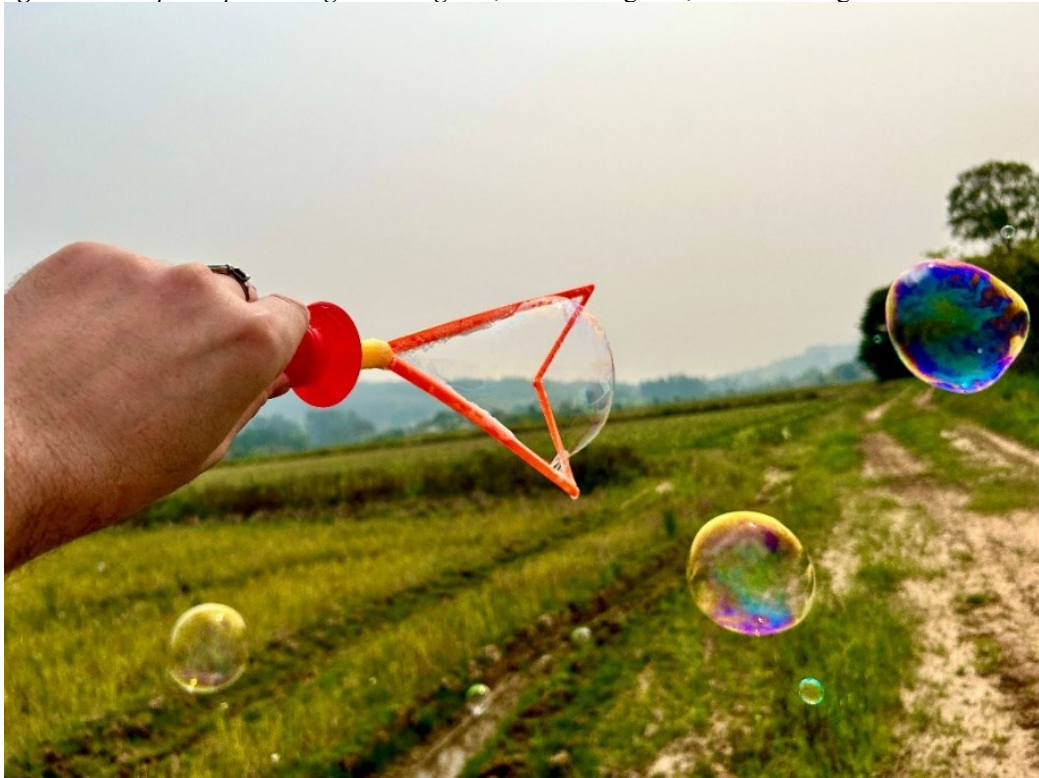
Figura 1 – Corpo-dispositivo: gesto inaugural , 2024. Mobgrafia, 24x40 cm. Agudo-RS

presença situada, que respira o espaço e se deixa atravessar por ele. Entre o passo e o sopro, entre espelhamentos e dobras, a imagem configura-se como travessia poética e experiência sensível.