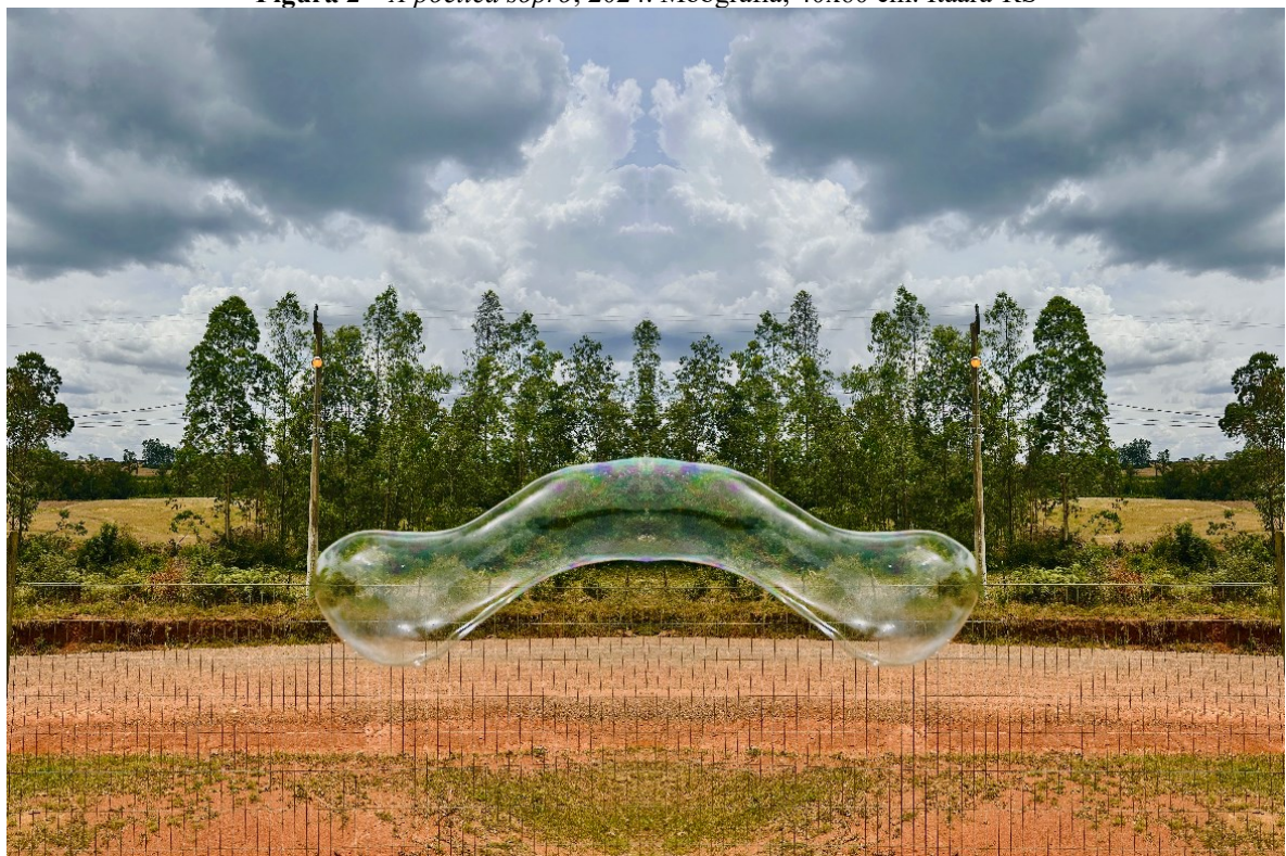
Figura 2 – A poética sopro , 2024. Mobgrafia, 40x60 cm. Itaara-RS