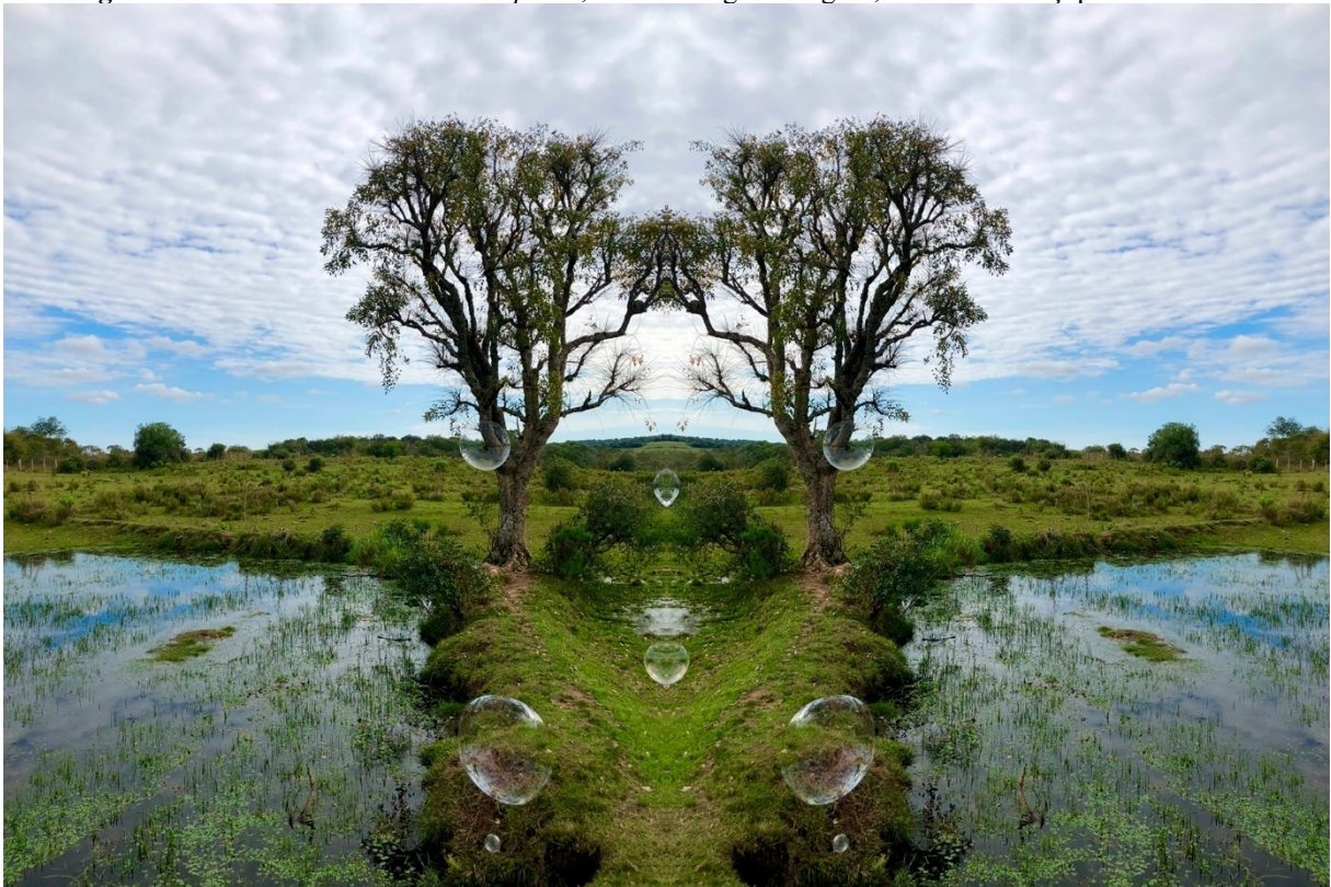
Figura 8 – Travessia simbólica em espelho , 2024. Mobgrafia digital, 40x60 cm. Caçapava do Sul-RS