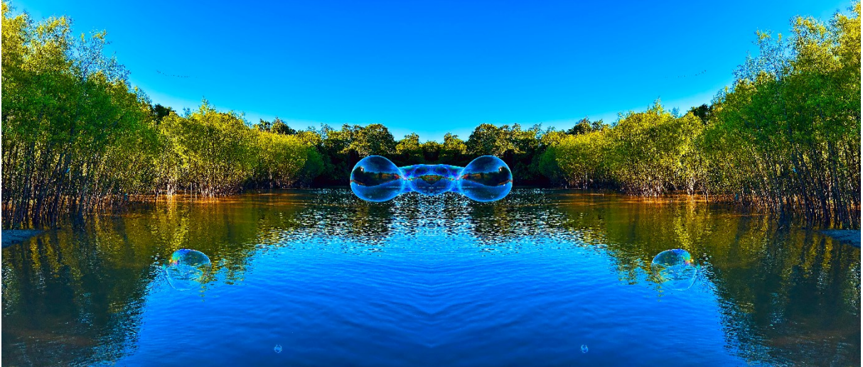
Figura 9 – Respiração do entre-lugar , 2024. Mobgrafia digital, 24x60 cm. São Sepé-RS