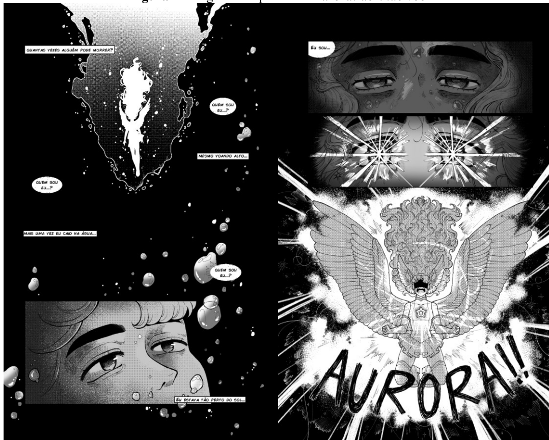
Figura 4 – Páginas do quadrinho Aurora: abrindo voo