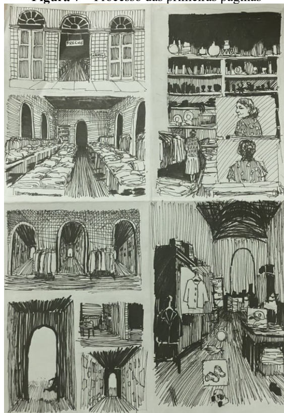
Figura 7 – Processo das primeiras páginas

No campo das referências, a obra dialoga com repertórios diversos. Há um fundo autobiográfico difuso, não com relato, mas como acúmulo de memórias e sensações traduzidas para a ficção. Visualmente, referências a artistas conhecidos pelo uso intenso do preto e branco, das hachuras e da construção de cenários estiveram presentes nas etapas iniciais do projeto, como Franklin Booth e Moebius. No entanto, essas referências foram tensionadas ao longo do processo por uma mudança estética significativa.