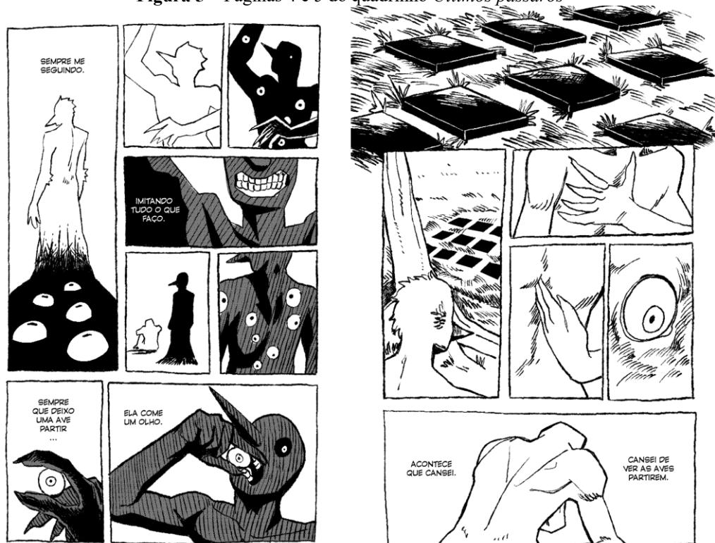
Figura 5 – Páginas 4 e 5 do quadrinho Últimos pássaros