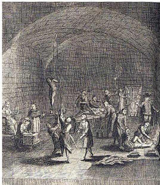
Torture chamber of the Inquisition *

Mas o meu corpo é um verme sem muletas e habita regiões desconhecidas donde a humanidade foi repelida.