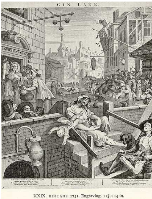
William Hogarth, Gin Lane (1751) Acervo do Foundling Museum of London