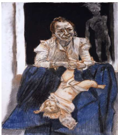
Paula Rego. Painel lateral direito de Oratório

À direita, mais duas imagens surgem repletas de narrativas cruéis. A primeira parece aludir a duas referências: a imagem do bebê evoca a gravura de William Hogarth, Gin Lane , do acervo do The Foundling Museum , mas também a famosa cena do astro americano Michael Jackson exibindo seu filho, perigosamente, de uma sacada de hotel.