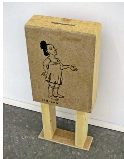
Oratório de Esmoler. Nossa Senhora com Menino (século XVII). Acervo do Museu do Oratório em Minas Gerais, Brasil. Caixa de coleta de esmolas, parte da instalação Oratório , de Paula Rego, na Casa das Histórias de Cascais, em Portugal.