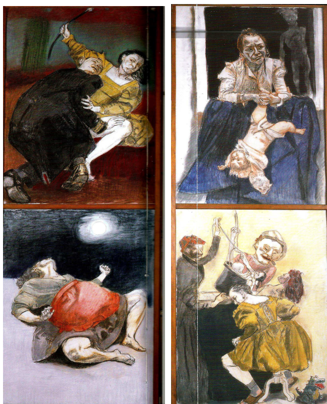
Painéis decorativos das portas do Oratório de Paula Rego

À direita, mais duas imagens surgem repletas de narrativas cruéis. A primeira parece aludir a duas referências: a imagem do bebê evoca a gravura de William Hogarth, Gin Lane , do acervo do The Foundling Museum , mas também a famosa cena do astro americano Michael Jackson exibindo seu filho, perigosamente, de uma sacada de hotel.