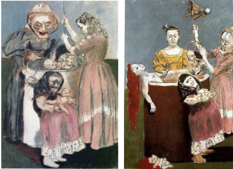
Estudos para o painel lateral direito do Oratório de Paula Rego

Numa das versões, uma jovem ajuda a bruxa a eliminar o bebê. Na outra, é a própria jovem que também aparece no poço, recém-parida, nua e exangue. Na versão escolhida pela artista há quatro mulheres: a figura da criança envelhecida é substituída pela de uma moça de vestido amarelo, talvez abortando, ao lado de outra jovem, nua dentro do poço. O bebê é manipulado pelas bruxas. A bonequinha de cabelos vermelhos que jaz ao pé do poço, reproduzindo a atitude desvalida da jovem mãe de longa cabeleira ruiva, é substituída na versão final por um brinquedo mais atualizado: um pequeno dinossauro verde, que confere uma nota de surpresa e curiosidade à cena.