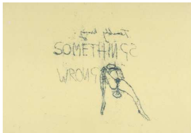
Tracey Emin. A week from hell (1994)

Um dos registros fala do ódio contra o parceiro, provavelmente viciado em drogas. No bilhete, há apenas palavras: "I will kill you, not now, not next week, perhaps when you least expect it, ...maybe in the next world" . Outro registro mostra a revolta contra a criança em seu ventre: "Get out from living inside of me" , e um outro afirma, sob o desenho de um corpo feminino esvaindo-se em sangue: "Something's wrong" .