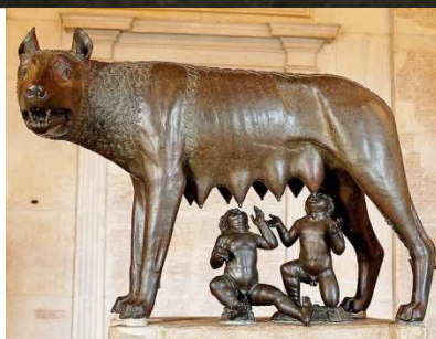
Mat Collishaw. Children of a lesser God (2007)

Collishaw também reflete sobre os desesperos míticos da parentalidade, numa releitura da lenda de Rômulo e Remo, os gêmeos roubados da mãe pelo tio e abandonados à morte, que teriam sido criados por lobos. Mais tarde, Rômulo assassina o irmão e torna-se o fundador de Roma. A montagem Children of a lesser God exhibe dois bebês humanos, nus, largados num sofá velho e sujo, num piso úmido, que parece o de uma calçada de rua, ladeados por um par de cães pastores e restos de pequenas carcaças de animais. Apesar do aspecto assustador dos cães e da decadência do lugar, os bebês parecem muito à vontade: o pezinho de um deles brinca com a orelha do macho, enquanto o outro parece tranquilo e confortável, mamando na fêmea. O cenário lembra o de um ambiente humano doméstico miserável.