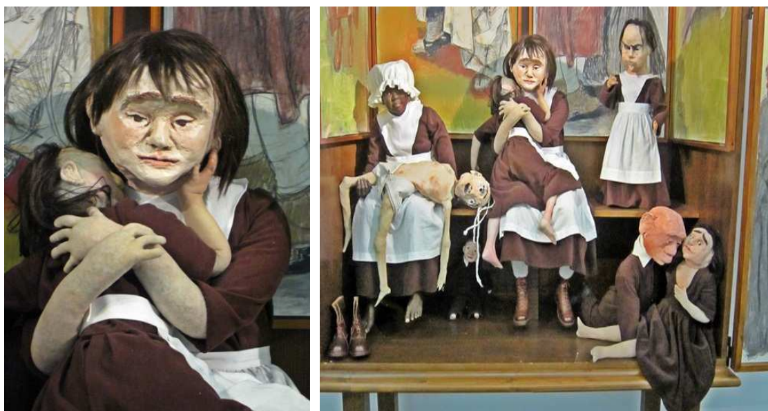
Cenas de Oratório , de Paula Rego

patéticas ou de mera sujeição: elas são frequentemente retratadas como cínicas bruxas, seres monstruosos a serviço da conspiração contra uma ilusão que a artista parece considerar a mais devastadora da história – a do autoritarismo masculino. É o que se percebe na instalação Oratório , um grande móvel com portas abertas contendo, no vão central, à guisa de “santos”, oito bonecos trajando o uniforme do hospital inglês (similar aos trajes religiosos) – severas túnicas marrons com aventais e gorros brancos – dispostos em atitudes nada compassivas. À exceção da figura principal, que evoca, talvez, a imagem de Nossa Senhora, e cuja expressão é cansada, porém amorosa, acolhendo com carinho a criança em seus braços, todas as demais implicam ou explicitam o terror que Paula Rego identifica na instituição que pretende “homenagear”.