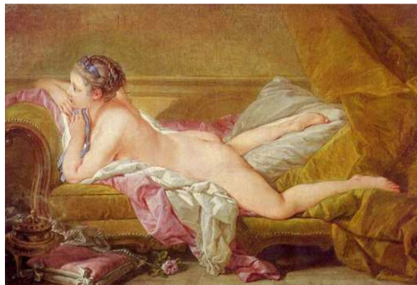
François Boucher. Blonde odalisque (1752)

O rococó é um estilo ligado às artes decorativas e à ornamentação, considerado mais frívolo, leve e imoral do que o barroco. Fragonard, assim como Watteau e Boucher, apelavam frequentemente para os temas orientais em suas pinturas, sendo comuns os retratos de odaliscas. A palavra “odalisca” significa uma escrava ou concubina em um harém, o que incendiava a imaginação do artista libertino com a sua cortesã. Desejo e sedução desempenham um importante papel no rococó. Para entender o que acontece nestas pinturas é preciso ter em mente as regras dos jogos sociais da época. Apesar da prostituição generalizada e do clima de deboche vigente na sociedade, o aristocrata e o burguês precisavam atender a rigorosos critérios de conduta, que mascaravam a libertinagem. A sedução era disfarçada, codificada, implícita. Fragonard e Boucher, contudo, rompem com os limites da decência – como se pode ver no quadro Blonde odalisque –, incorrendo, assim, na ira dos críticos de arte.