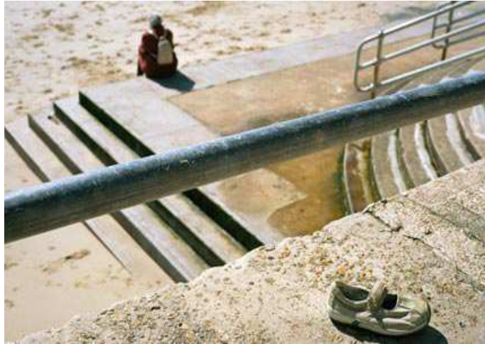
Tracey Emin. Baby Things (2010)

Uma decisão assim não é destituída de consequências. A atividade feminista de Emin petrificou algo em seu íntimo, roubando-lhe, nos anos mais radicais de sua militância, a realização do desejo de ser mãe. Talvez por isso, no exterior do prédio, Emin reflita sobre essa nostalgia, através de pequenos objetos petrificados em bronze, como ursinhos de pelúcia e peças de roupas de bebê: toucas, meias, luvas e sapatos perenizados em bronze, distribuídos pelas escadas, pelo pátio, sobre as grades, sob os bancos, numa discreta demonstração de solidariedade para com as mulheres que a antecederam na culpa por seus atos desesperados; e cujos filhos, quando vingados, foram parar em lugares como o orfanato Foundling . O desamparo desses mínimos objetos eternizados por Emin, quase invisíveis aos passantes, refletem o desamparo das mulheres e crianças anônimas cujo sofrimento não foi visto, denunciado ou partilhado por ninguém. A inspiração para esta obra, segundo ela, teria vindo da sugestão de Hemingway para “o conto mais curto e mais triste jamais escrito”: “Sapatos de bebê à venda. Sem uso.”; e de uma confissão da artista, que na meia-idade vem a público dizer do seu arrependimento e da sua intenção, tardia, de voltar a engravidar. 5