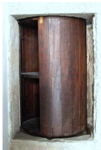
A “Roda dos Expostos e Enjeitados”