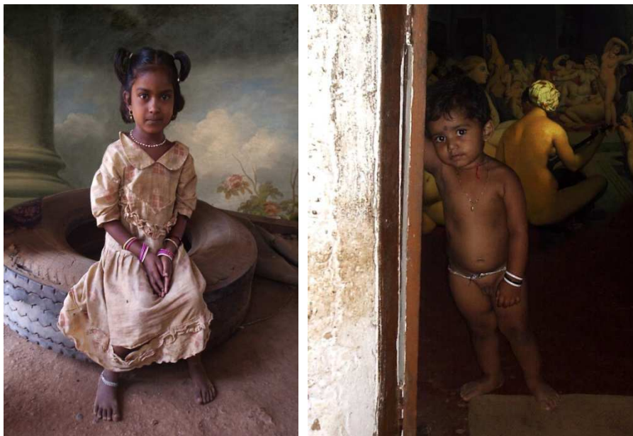
Mat Collishaw. Idle Young , 2004 (Digital print). As fotografias aludem ao tema da pedofilia e

Mat Collishaw parece compartilhar a ideologia deste feminismo tardio na sua exposição levada ao Foundling Museum , intitulada Idle Young : uma série de requintadas montagens fotográficas, realizadas em 2004, com estampas de crianças de rua indianas, provavelmente vítimas de prostituição, retratadas sobre cenários do século XVIII extraídos das obras de grandes pintores românticos europeus, como Gainsborough, Fragonard, Ingres. Uma linda menina, por exemplo, cuidadosamente penteada e ornamentada com bijuterias, é fotografada num cenário contrastante, onde a sua aparência, superposta à elegância de um pano de fundo em trompe l'oeil – provavelmente uma sacada florida extraída de uma cena ao estilo rococó de Fragonard – entra em choque com a pobreza de suas roupas rasgadas e a realidade de seus pés descalços num chão de terra batida, sentada sobre um imundo pneu de caminhão. Claramente exposta, a criança se oferece aos passantes, no interior de sua realidade, assim como aos observadores da fotografia. A inocência de seu olhar é uma acusação, ainda mais chocante pelo completo estado de vulnerabilidade em que se encontra, acentuado pela hipocrisia e artificialidade da cena artística.