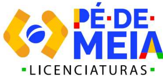
Figura 1: Logomarca da ação Pé-de-Meia Licenciaturas