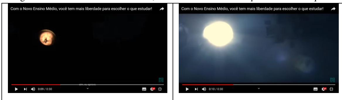
Imagem 3 - Com o Novo Ensino Médio, você tem mais liberdade para escolher o que estudar