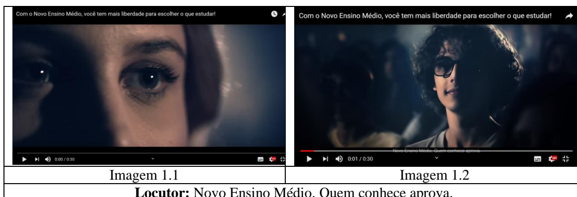
Imagem 1 - Com o Novo Ensino Médio, você tem mais liberdade para escolher o que estudar