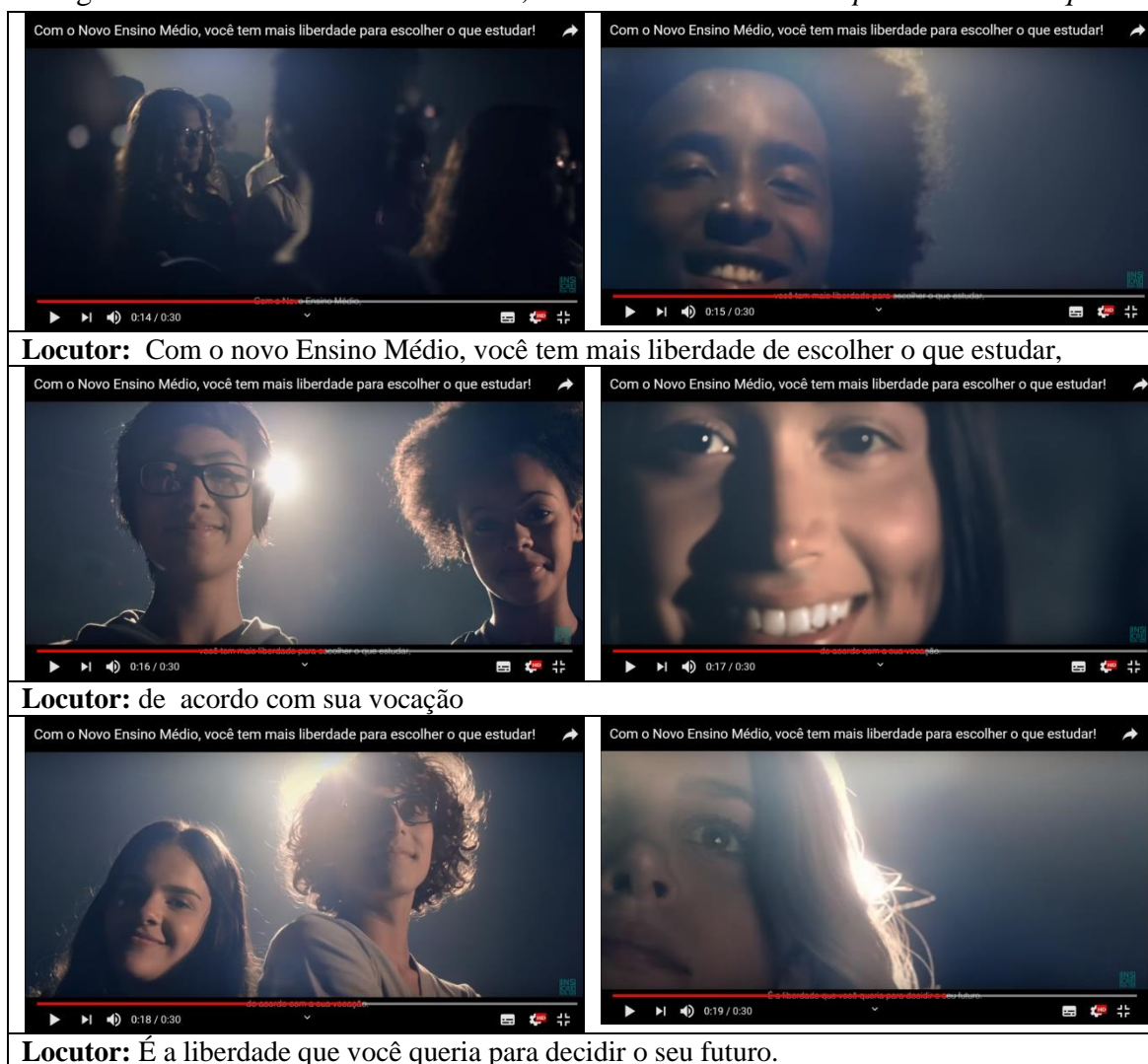
Imagem 5 - Com o Novo Ensino Médio, você tem mais liberdade para escolher o que estudar