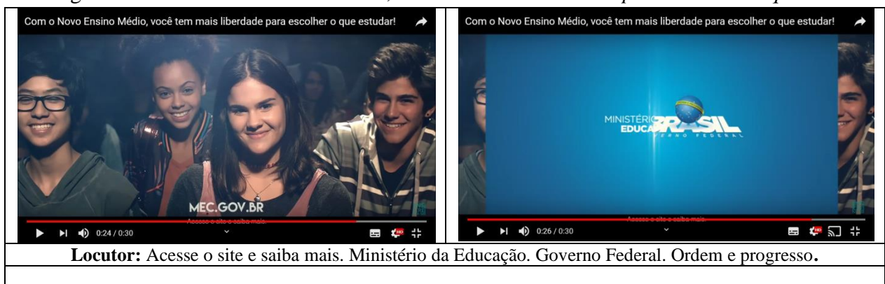
Imagem 7 - Com o Novo Ensino Médio, você tem mais liberdade para escolher o que estudar