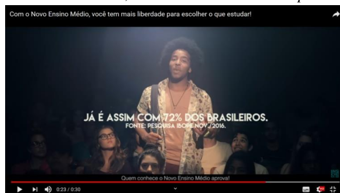
Imagem 6 - Com o Novo Ensino Médio, você tem mais liberdade para escolher o que estudar