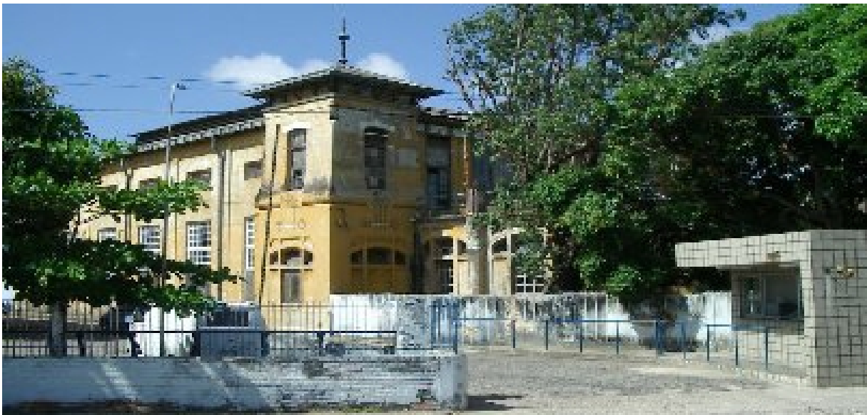
Figura 1: Vista da estação elevatória. Av. Saturnino de Brito, nº 472. Bairro do Cabanga – Recife – PE.

No Estado de Pernambuco, há edificações públicas (Figuras 1 e 2) e residenciais (Figura 3) que indicam a propagação da técnica e da estética do Art Nouveau na paisagem urbana de cidades como Recife, Olinda, Cabo de Santo Agostinho e Pesqueira, abrigando estações elevatórias de esgotos, pavilhões sanitários, residências e ainda com gradis, azulejos, mobiliário, objetos decorativos e design gráfico. As características diversas do Art Nouveau também foram observadas nas edificações analisadas nesta pesquisa. Como podemos ver nas imagens a seguir, estes foram os exemplos estudados de acordo com o que foi indicado nos procedimentos teórico-metodológicos, ou seja, mediante comparações das edificações — o Art Nouveau frente ao Colonial Urbano, ao Neoclassicismo e ao Historicismo Eclético.