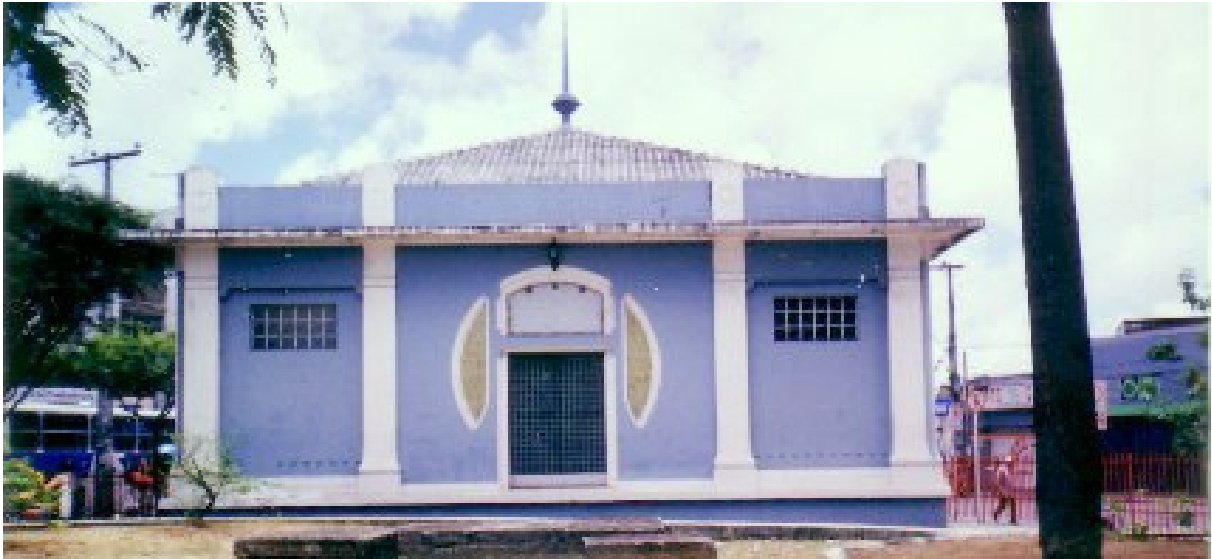
Figura 2: Estação elevatória. Largo da Paz. Bairro de Afogados – Recife – PE.