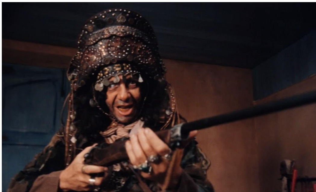
Figura 7- Cena 2: o cangaceiro adentra a igreja para saquear (54 min:41 seg).

É notável ainda, a diferença entre os trajes, apesar de serem do mesmo movimento, Severino possui muito mais adereços de valor e jóias, uma vez que seu figurino também serve para delimitar sua posição social, pois o diferencia do modelo padrão do grupo para destacá-lo como chefe da gangue, ganhando o respeito dos outros integrantes.