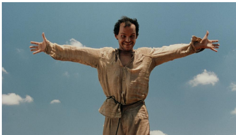
Figura 01- João Grilo, um dos personagens principais do filme O Auto da Compadecida (2000).