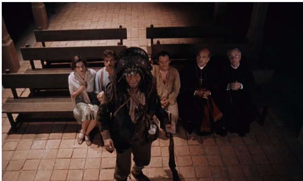
Figura 8- Cena 03: após morrer, Severino é julgado por seus crimes (01h:25 min:11 seg).

A expressão ameaçadora traz um recorte do psicológico instável e perigoso do personagem, acentuado pelo destaque da forma das peças de prata na cabeça, ressaltando seu rosto. O figurino se mostra então relacionado também com os fatores emocionais, ou seja, não é o único fator de definição dos significados da cena (COSTA, 2002).