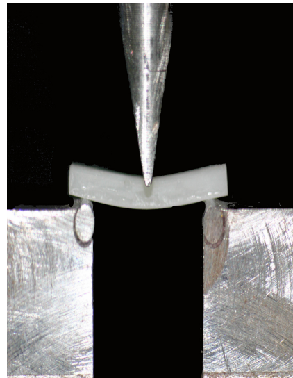
Figura 2 – Corpo-de-prova em momento de flexão

O ensaio mecânico de resistência à flexão adotado foi o de flexão de três pontos (ISO 4049), realizado pela máquina de ensaio universal (Modelo DL-1000, EMIC Equipamentos e Sistemas LTDA., São José dos Pinhais - PR - Brasil), onde os pontos de apoio eram formados de dois cilindros com 2mm de diâmetro, localizados paralelamente à distância de 20mm entre seus centros. O terceiro ponto, confeccionado nas mesmas dimensões dos anteriores e o responsável pela aplicação da carga, encontrava - se centralizado e paralelo aos demais. O ensaio foi realizado a uma velocidade de 0,8mm/min (Figura 2).