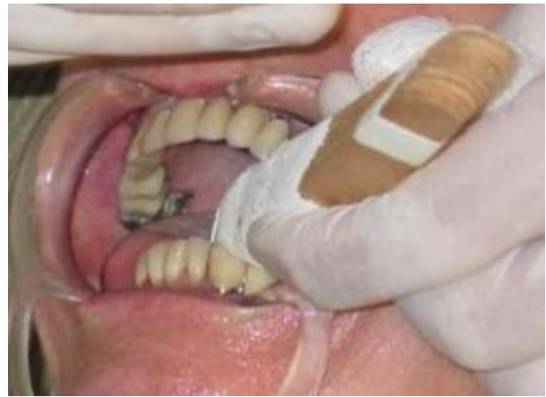
Figura 1 - Utilização de meios auxiliares (abridor de boca e afastador) na adaptação profissional.

Foram solicitadas tomadas radiográficas periapicais como recurso auxiliar diagnóstico e posterior elaboração do plano de tratamento.