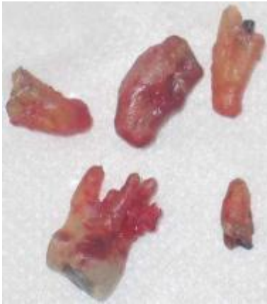
Figura 4 – Dentes 17, 16, 43 e 48 extraídos – possíveis focos de infecção e sintomatologia dolorosa.

A remoção das suturas foi feita 15 dias após a intervenção cirúrgica na residência da paciente, bem como orientações de higienização e manutenção da saúde bucal da cavidade bucal da mesma, inclusive da parte posterior de sua língua com limpador de língua diariamente, região onde o grande acúmulo de placa bacteriana devido à hipossalivação presente pode comprometer seu Sistema Respiratório 13 .