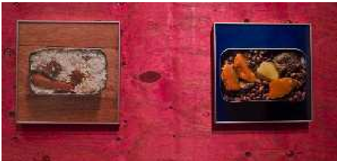
Figura 09: Edu Simões . Gastronomia para um dia de trabalho duro .