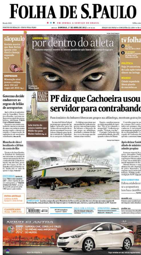
Figura 01: Jornal Folha de São Paulo, 1.4.2012

O simbolismo da imagem pode ser deduzido não só pelo que é mostrado, mas pelo contexto em que a imagem aparece. O simbolismo interno à foto, por outro lado, pode também ser enfatizado como se vê na prática diária do fotojornalismo em que situações banais adquirem sentido específico dentro de determinado contexto histórico. Basta lembrar da famosa foto do ex-presidente Jânio Quadros com os pés torcidos sugerindo a falta de rumo do seu governo. 3 A cobertura de política é rica nesse tipo de exemplo em que se procura atribuir uma conotação a uma expressão do personagem que seja a mais adequada à notícia do momento, podendo-se para isso recorrer até mesmo a fotos de arquivo. A flexibilidade com a exigência de uma foto do dia demonstra que mais do que um flagrante, o que importa é a interpretação que a imagem pode sugerir.