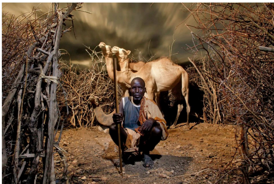
Figura 06 : Alejandro Chaskielberg. Turkana à noite (2012)

Exemplo equivalente pode ser encontrado também recentemente relacionado a tema clássico do fotojornalismo, ou seja, a situação dos catadores de lixo do Aterro do Jardim Gramacho, no Rio de Janeiro, em vias de ser desativado. O jornal Le Monde (17.5.2012) publicou galeria de doze fotos de Fred Merz em que há nitidamente uma luz artificial bem montada embora os catadores apareçam na maioria das imagens em ação, ou seja, catando lixo. O olhar fotográfico é destacado também pela maneira deliberada com que o suíço Fred Merz usa diferentes estratégias para não mostrar o rosto deles na maioria das imagens. O ensaio