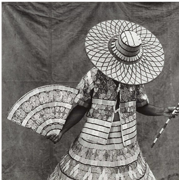
Figura 11: Rogério Reis, Carnaval na Lona , Fantasia de Palitos de Fósforos , 1988.