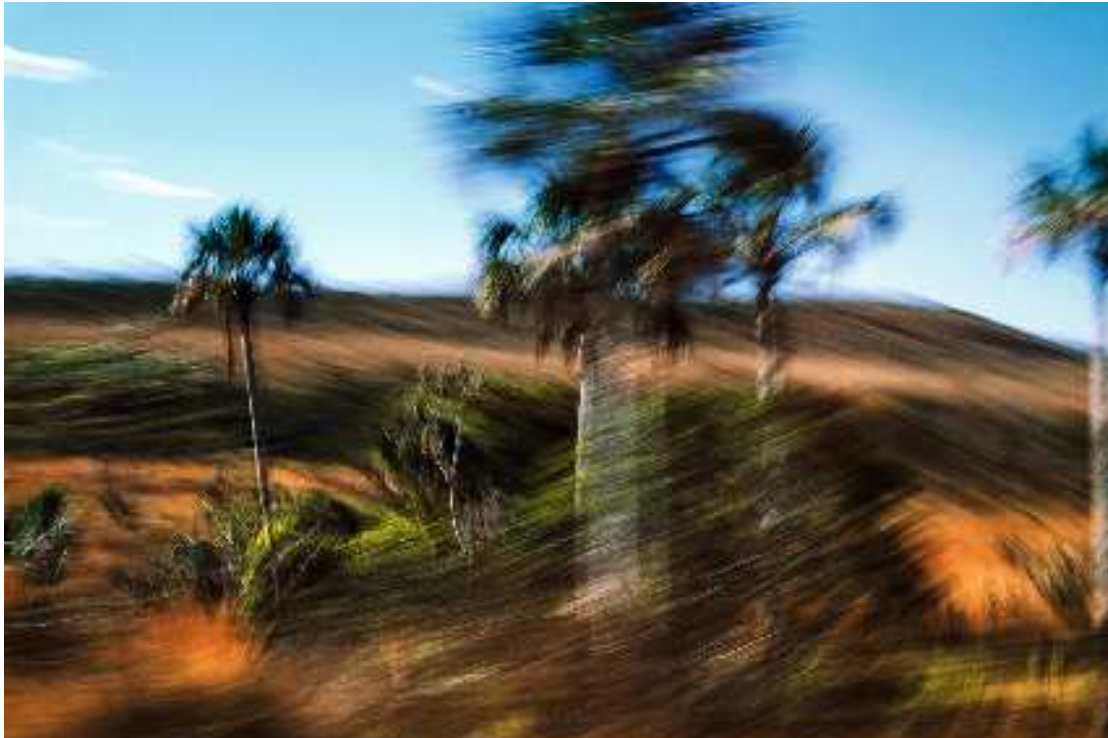
Figura 03: Patrícia Gouveia. Imagens Posteriores