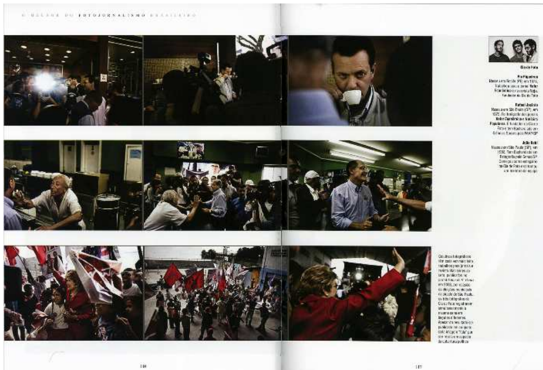
Figura 05: Cia da Foto, 2008. Publicado originalmente na Folha de São Paulo e reproduzido no livro O melhor do fotojornalismo brasileiro – edição 2009 (ARAÚJO, 2009).