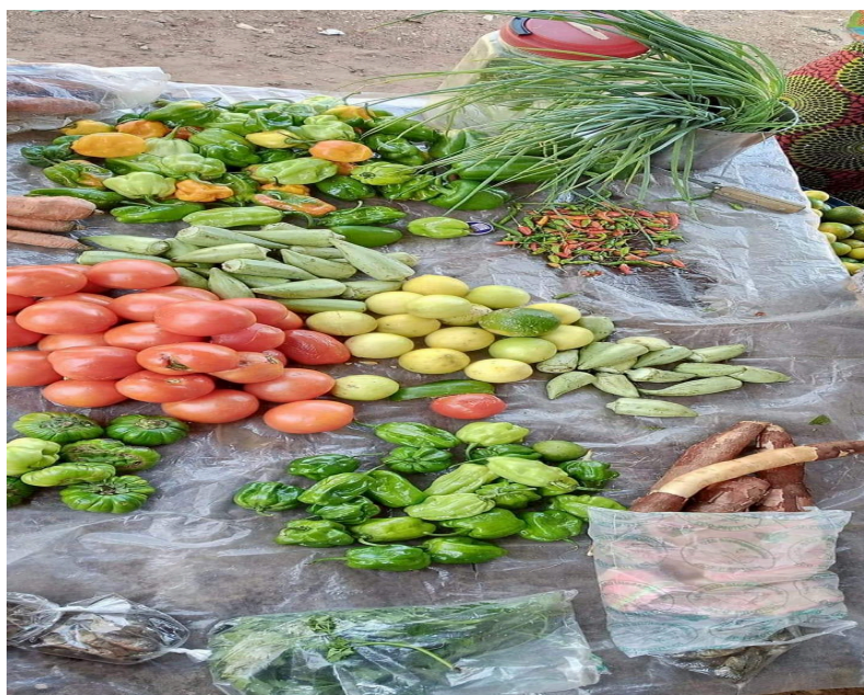
Figura 2 - Produtos comercializados no espaço verde.

Data: 21 de janeiro de 2020.