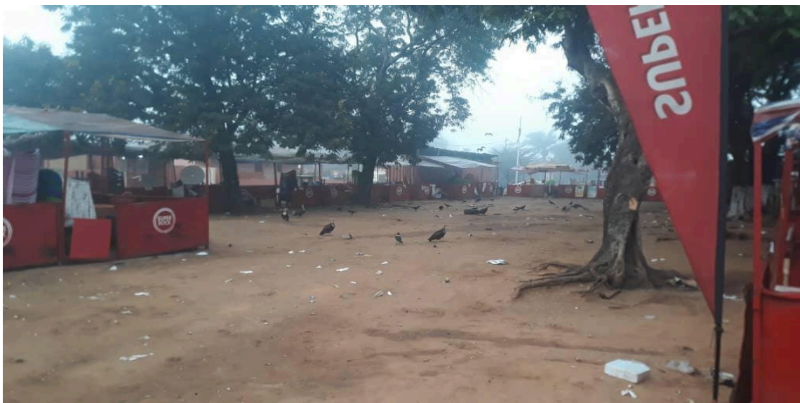
Figura 1- Espaço verde, lugar adaptado pelo governo na pandemia para as mulheres do mercado informal comercializarem os seus produtos.

data: 21 de janeiro de 2022.