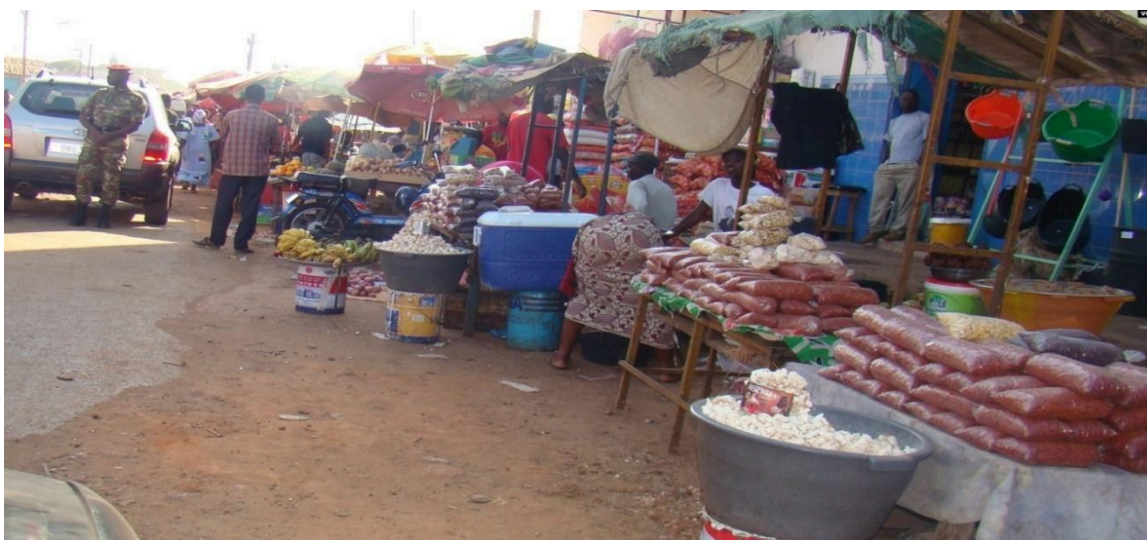
Figura 3 - Lumo de Cacheu