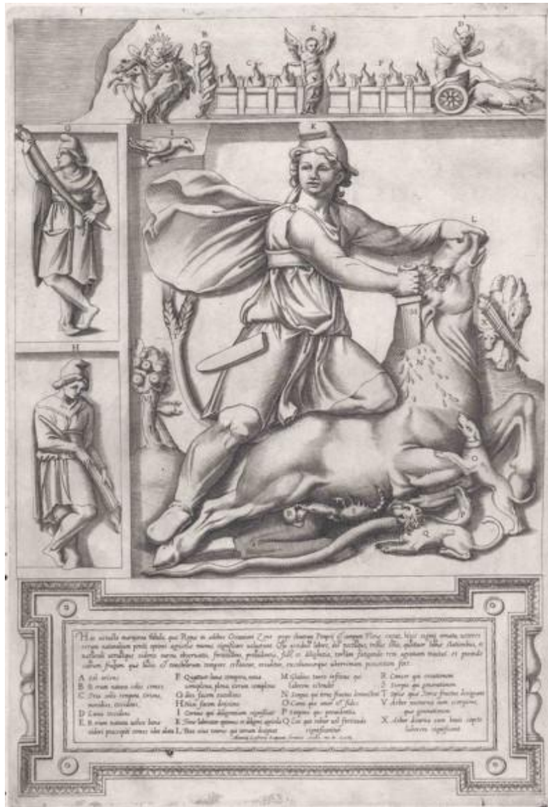
Figura 2: Artista: Anónimo. Estatua de Mitra. Grabado. Editor: Antonio Lafreri, Speculum Romanae Magnificentiae . Roma, 1564. 48

vado un dibujo de este mismo relieve 47 . Esta ilustración incluye la interpretación de las escenas que elabora Lafreri. Las reproducciones de los siglos XVII y XVIII toman como referencia este primer dibujo, aunque se incrementan progresivamente el número de imprecisiones.