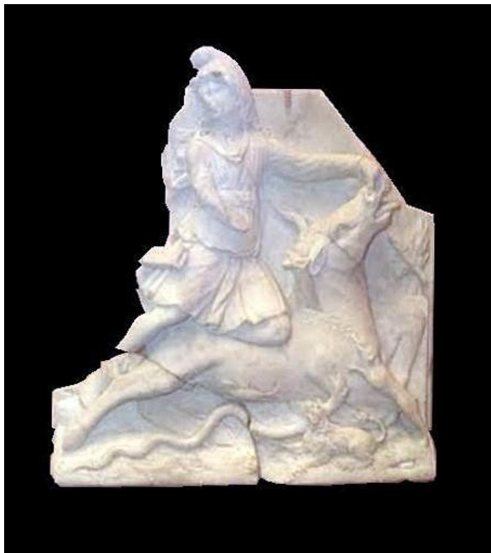
Figura 1: Relieve de tauroctonía mitraica, s. I d.C. Colección del Museo de Arqueología y Etnología de la Universidad de São Paulo, Brasil.

La primera versión conocida que incluye un comentario de este monumento figura en el Speculum romanae magnificentiae de Antonio Lafreri, editado en Roma en 1564. 46 Dos años antes aparece en Venecia la obra de Ulisse Aldrovandi (1562), intitulada Delle statue antiche, che per tutta Roma, in diversi luoghi, et casesi veggono , que nos aporta el primer testimonio publicado sobre este monumento, realizando una descripción de una escena tauróctona, pero sin interpretarla, desconociendo completamente su significado simbólico-religioso. En el Codex Pighianus de Berlín, que data en torno a 1550 (Pighius estuvo en Roma entre 1549 y 1557), se ha conser-