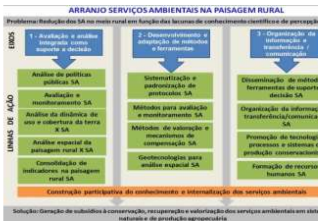
Figura 2. Principais eixos e linhas de pesquisa abordados no Arranjo de Projetos: Serviços Ambientais na Paisagem Rural (Arranjo SA). Elaborada pelos autores.