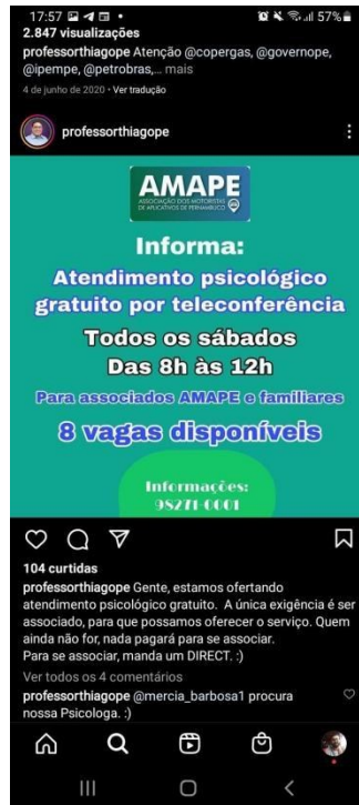
Figura 4 - Print de tela do Instagram de Thiago

como a flexibilidade imanente a essa categoria de trabalhadores se amolda às rotinas singulares de cada uma das e dos motoristas.