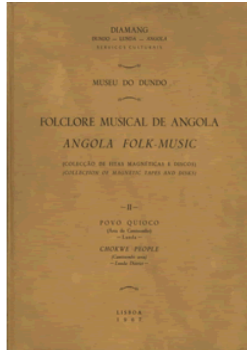
Figuras 01 e 02. Folclore Musical de Angola. Volumes I e II, Povo Quioco (Área do Lóvua e Camissombo) .

Estes livros, notoriamente com pretensões propagandísticas e políticas, pretendem divulgar não só a cultura do nativo da Lunda mas também a ideia de que esse trabalho de recolha e estudo foi apenas possível pela convivialidade e colaboração pacífica entre brancos e negros. Combinam a missão civilizadora e de salvação científica, cultural com o discurso do lusotropicalismo, no sentido de um colonialismo harmonioso e sem racismo, numa altura em que a imagem de Portugal na cena internacional era frágil na medida em que permanecia, à revelia de outras potências europeias, com colónias (NETO, 1997).