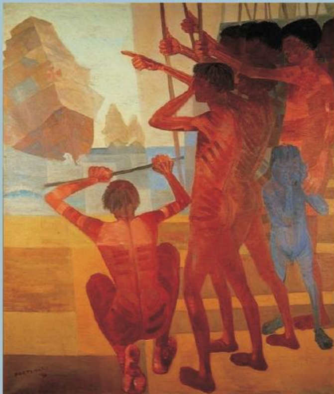
O descobrimento do Brasil, Cândido Portinari, 1956

Vol. 1, nº 01, Jan/Jun 2011 www.revista-realis.org