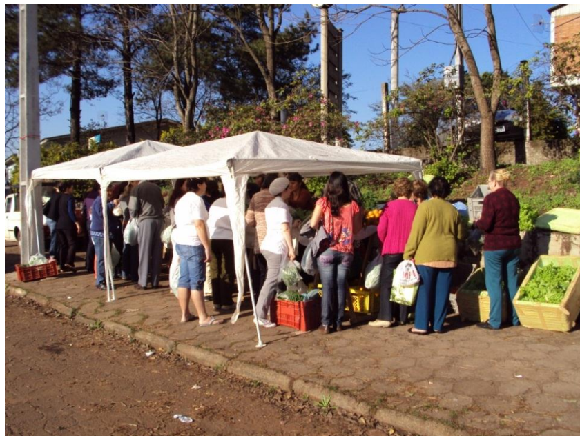
Figura 1 - Feira Agroecológica em Francisco Beltrão.

Alimentos da Secretaria da Agricultura do Governo Federal; 4) em mercados verejistas convencionais (supermercados) do município e da região e; 5) direta na feira de produtos orgânicos promovida por iniciativa dos próprios agricultores. Essa feira se constitui na prioridade dos agricultores envolvidos no que tange a comercialização. A relação direta que ocorre entre produtor e consumidor na feira é bastante significativa, caracterizando-se como uma relação de mercado solidário. O espaço para a realização da feira é pequeno e se dá na calçada de uma via pública. As tendas não são fixas e a exposição dos produtos não é a mais correta (figura 1).