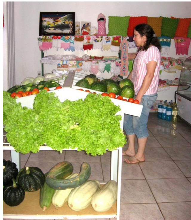
Figura 2 - Mercado da APAV em Verê-PR.

produção, do processamento e da comercialização dos alimentos. Contudo, as lideranças da APAV afirmam que a prioridade é abastecer o mercado local e regional. A figura 2 apresenta o espaço de comercialização da APAV em Verê, com produtos in natura e industrializados. Alguns produtos industrializados comercializados no mercado não são agroecológicos.