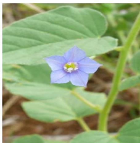
Jacquemontia evolvuloides Meisn (Convolvulaceae)