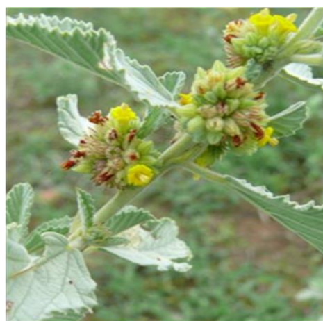
Waltheria rotundifolia Schrank (Sterculiaceae)