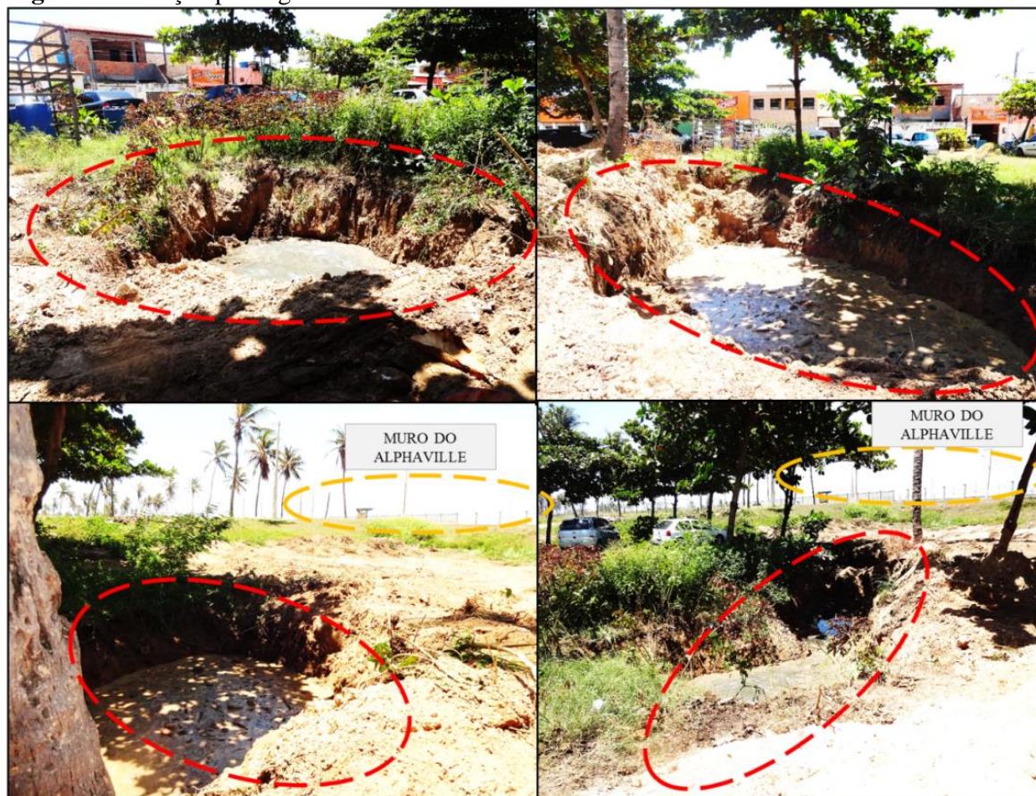
Figura 1: Poluição por esgotamento sanitário na Praia da Costa