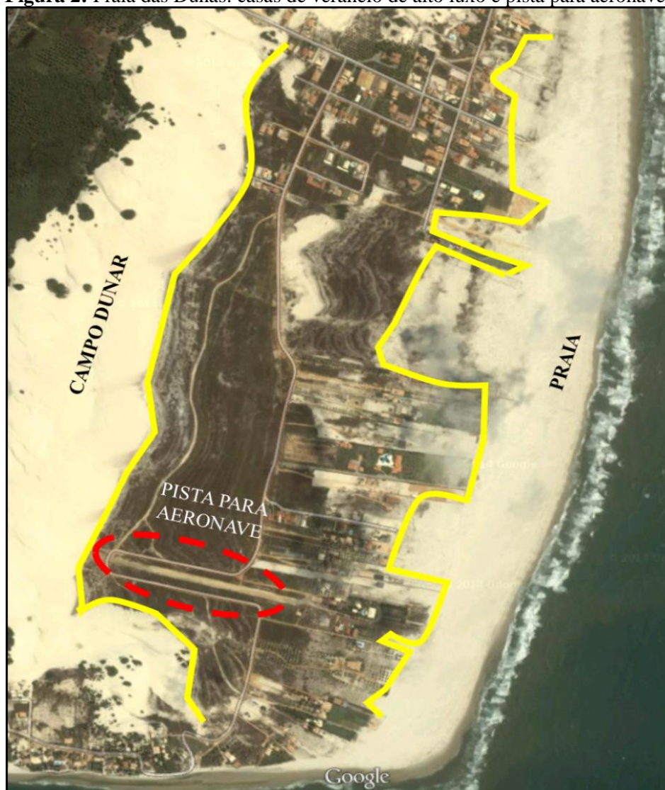
Figura 2: Praia das Dunas: casas de veraneio de alto luxo e pista para aeronaves